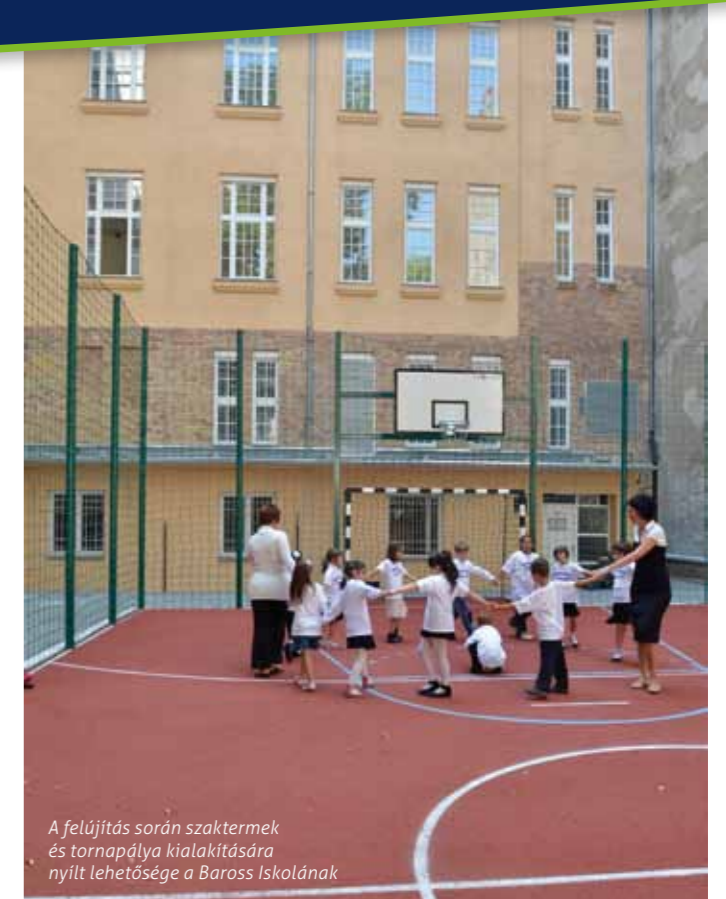
A felújítás során szaktermek és tornapálya kialakítására nyílt lehetősége a Baross Iskolának