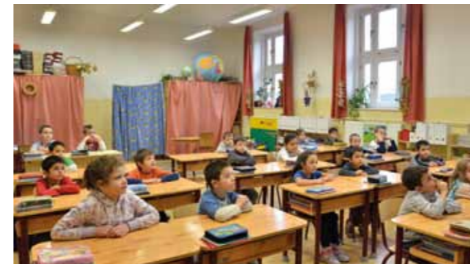
A korszerűsített tantermek egy színvonalas környezetet biztosítanak a gyerekek mindennapi tanulásához.