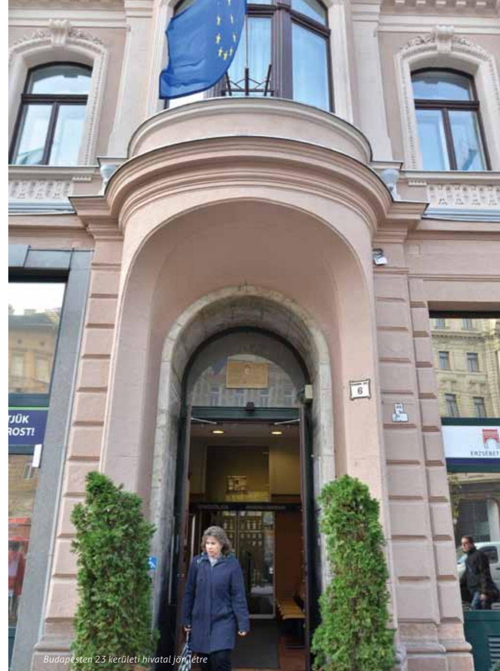
Budapesten 23 kerületi hivatal jön létre

ha valamilyen államigazgatási ügyet akarunk elintézni, és a dokumentumok előzetes beszerzésével sem kell bajlódni. Az új ügyintézési rendszer bevezetésétől az állam és az állampolgárok közötti bizalom helyreállítását várja a kormány.