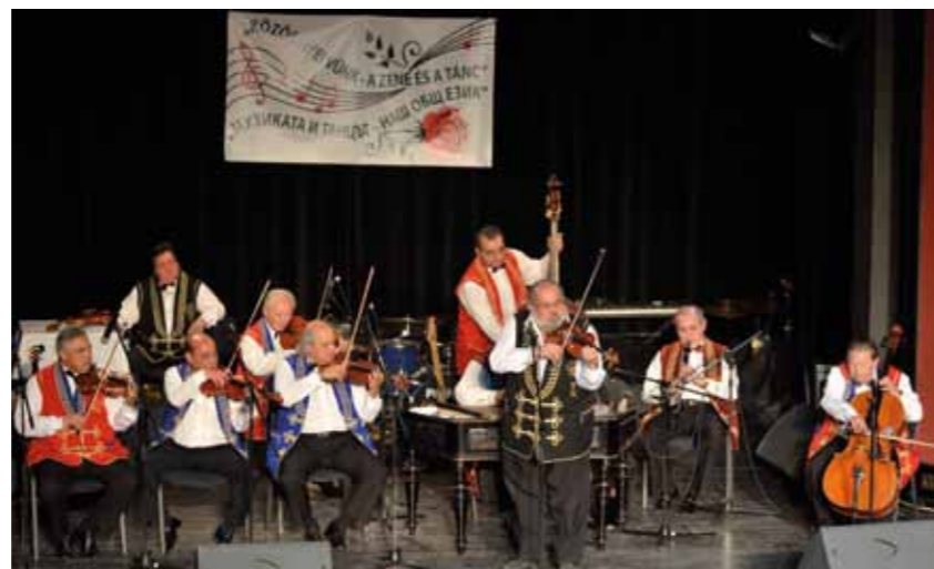
A 100 tagú cigányzenekar Erzsébet Héten játszott ünnepi műsora

A több mint 80 éves Bethlen téri Színház, amely 15 éve a kortárs táncművészet otthona „Csikágóban”,