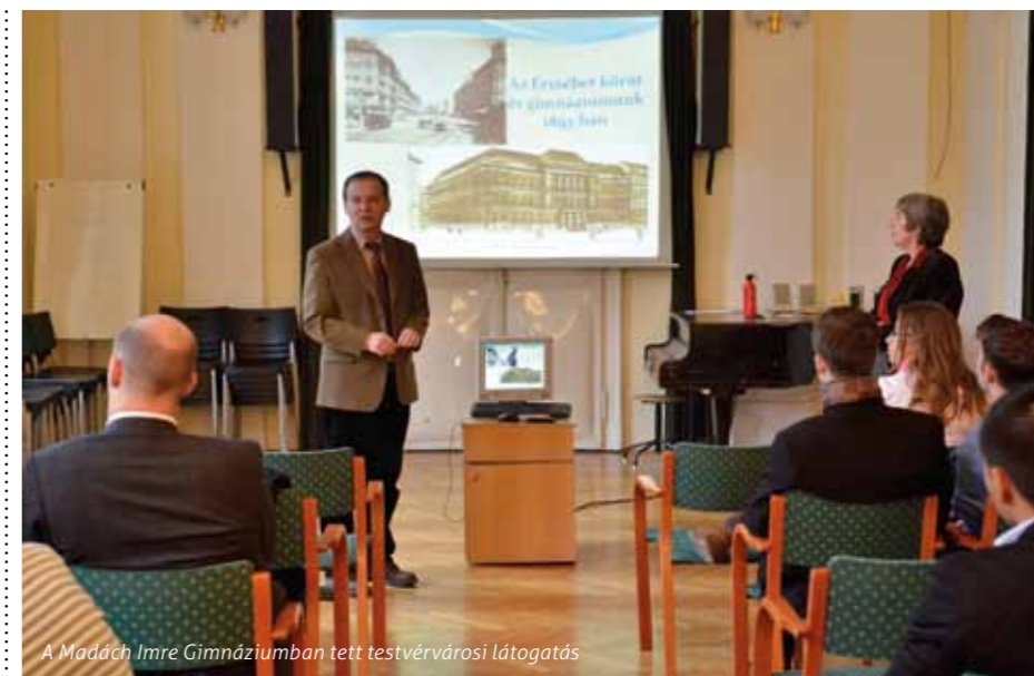
A Madách Imre Gimnáziumban tett testvérvárosi látogatás

Névadás-kézfogás címmel a kerület névadásának 130. évfordulója tiszteletére az Erzsébetvárosi Civil Szervezetek Szövetsége és az ERÖMŰVHÁZ szervezett helytörténeti vetélkedőt a kerületi iskolák 3