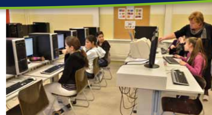
A diákok korszerűsített szaktermekben sajátíthatják el gyakorlati tudásukat