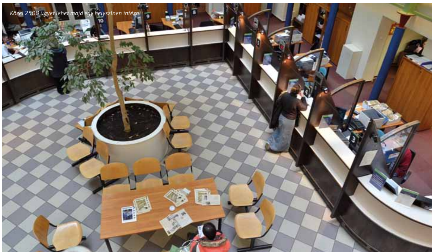
Közel 2500 ügyet lehet majd egy helyszínen intézni

Az ügyfelek számára a legszembetűnőbb változás az ügyintézés