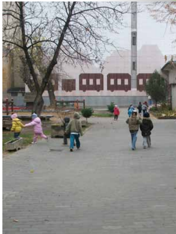
A Kópévár Óvoda a támogatásnak köszönhetően újította fel udvarát és tette balesetveszélymentessé