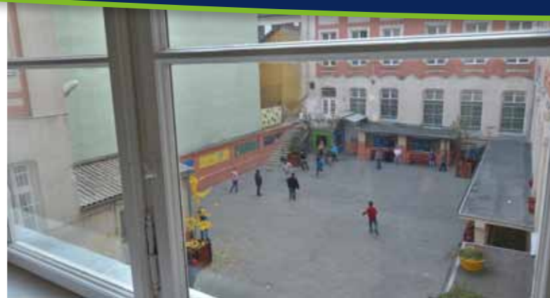
Az erzsébetvárosi kéttannyelvű iskolában kicserélték és korszerűsítették a nyílászárókat