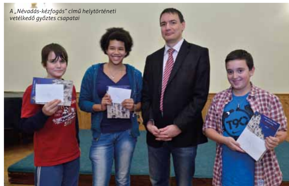
A „Névadás-kézfogás” című helytörténeti vetélkedő győztes csapatai

királyné verseire komponált dalok, amelyek zenéjét az együttes karnagya, Kapi-Horvátth Ferenc ezredes szerezte.