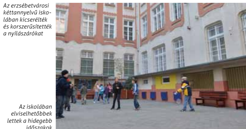
Az iskolában elviselhetőbbek lettek a hidegebb időszakok