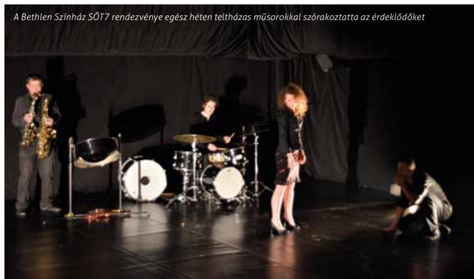
A Bethlen Színház SÓT7 rendezvénye egész héten teltházassal szórakoztatta az érdeklődőket

A Nemzeti Adó- és Vámhivatal Pénzügyőr Zenekara immár másodszor adott nagyszerű koncertet november 17-én az ERÖMŰVHÁZban, ahol Liszt, Strauss és Brahms muzsikája csendült fel, valamint Erzsébet